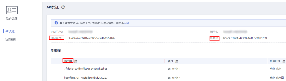
图 3-2 获取账号 ID