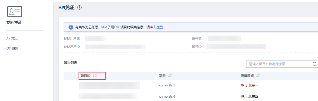
图 3-1 查看项目 ID